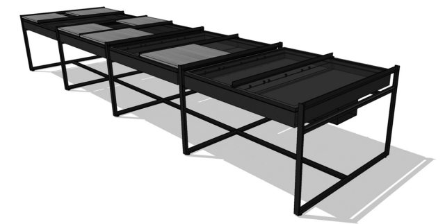
DESIGN : DAVID GOUR