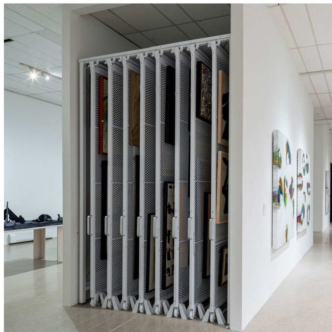
LA RÉSERVE OUVERTE.

Ainsi, le mobilier d'exposition installé au centre de la salle sert à la fois d'écrin pour les archives de l'institution et de table de réunion pour les rencontres avec le comité de développement artistique. Ce comité a pour mandat de repenser le champ artistique du Musée, sa collection et sa vision de la diffusion de l'art contemporain. La question, qui animera les échanges tout au long de l'exposition, sera orientée sur le rôle esthétique et politique d'une institution de la nature d'un musée d'art contemporain.